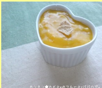
カクタン★かぼちゃのフルーチェババロア