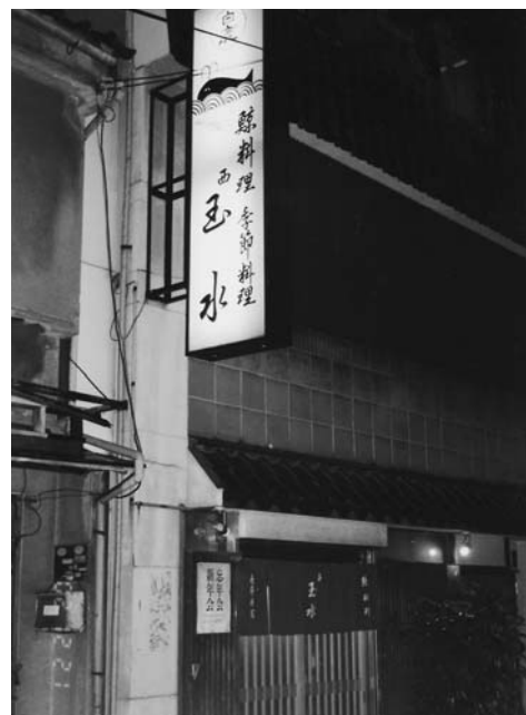
鯨料理専門店「西玉水」

「鯨肉調味方」には生の赤身が7種の料理に使われているが、造りは出てこない。今は冷凍技術の進